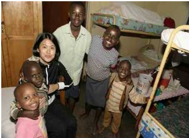
写真：高駐在員と孤児院の子どもたち

この視野に基づき、ARCは2002年に奨学基金を開設し、賛同して下さった支援者の方々のお蔭で、キガリ市内の孤児院に養育されている孤児105名を初等教育に送ることが出来ました。