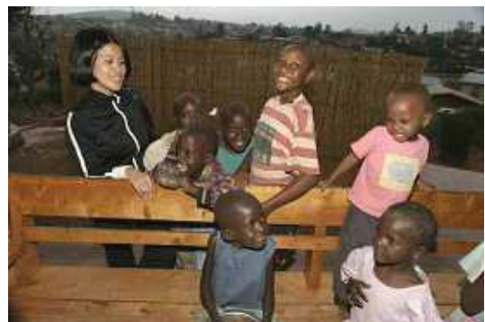
写真：高駐在員と孤児院の子どもたち (ARCインターン分部真由美撮影)

現在、ルワンダには約810,000人の孤児がいると推定され、うち約160,000人がエイズ孤児です。また、約100,000人の子どもが15,023の子ども世帯家庭で暮らしていると言われており、そのうち多数がキブエ県、キブンゴ県、ギタラマ県にいます(ルワンダ、ジェンダー省による数値。UNICEFの数値は42,000子ども世帯家庭に101,000人の子ども。)。約3,500人の子どもが孤児院で暮らしており、約7,000人のストリートチルドレンがいると言われています。他にも、暴力の加害者として拘留されている子どもや、親がエイズに感染しており数年のうちに孤児になる子どもたちもいます。