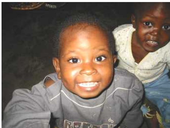
ルワンダの孤児院の子ども